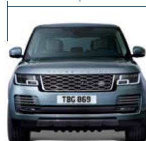
Carreggiata anteriore 1.693 mm

Larghezza 2.073 mm con specchietti retrovisori chiusi Larghezza 2.220 mm con specchietti retrovisori aperti