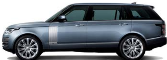
Passo lungo (LWB) 3.120 mm