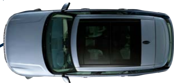
Lunghezza veicolo con passo standard 5.000 mm (passo lungo 5.200 mm)