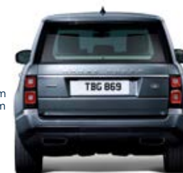
Carreggiata posteriore 1.685 mm